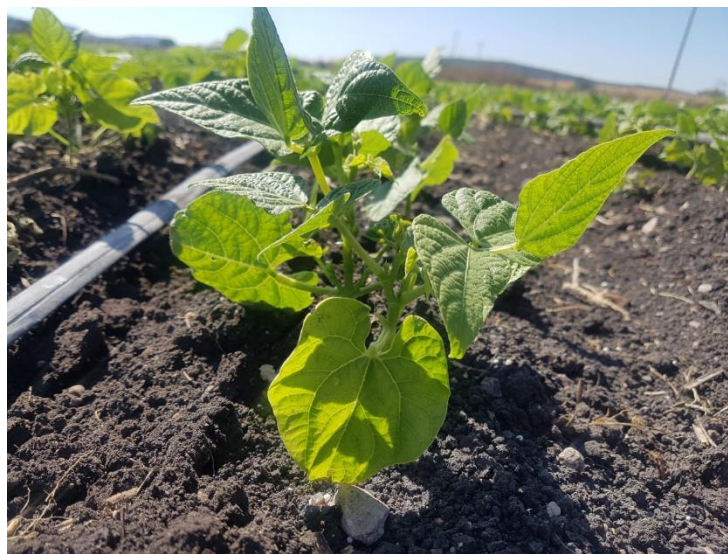
Figura 1. Plántula de Frijol

En busca de cumplir con los objetivos del Plan Nacional de Desarrollo 2019-2024, y lograr la autosuficiencia agroalimentaria y rescate del campo, el Gobierno Federal ha emprendido el Programa de Producción para el Bienestar, convirtiéndose en una prioridad de atención para el Servicio Nacional de Sanidad, Inocuidad y Calidad Agroalimentaria (SENASICA) en materia de sanidad vegetal, por lo que se informan las actividades relacionadas al cultivo de frijol desarrolladas conforme la estrategia operativa de la campaña Manejo Fitosanitario en Apoyo a Frijol.