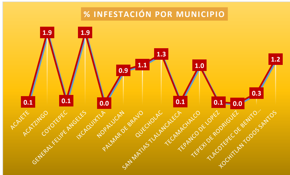
Gráfica 3. % infestación de ootecas de Chapulín por municipio, marzo 2020

Densidad poblacional de Chapulín ( Brachystola sp, Sphenarium sp, Melanoplus sp). - Con el propósito de determinar la densidad de ootecas por metro cuadrado y calcular la población esperada de la plaga, se realizó el muestreo en cada sitio con la metodología 5 de oros removiendo la capa superficial del suelo a una profundidad de 10 cm. aproximadamente, obteniendo un promedio de infestación de 0.7% (gráfica 3).