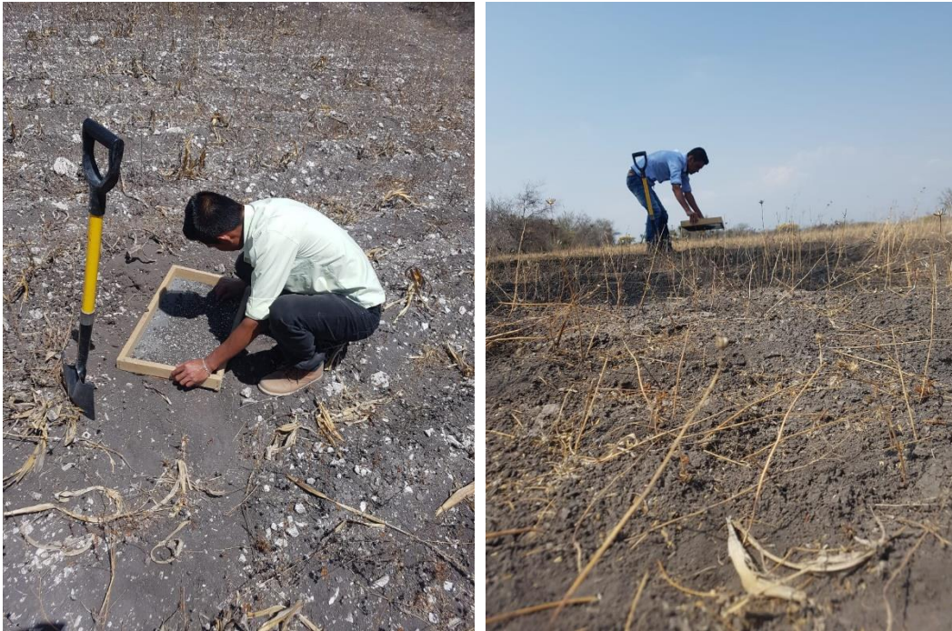
Figura 2. Muestreo de ootecas de chapulín.